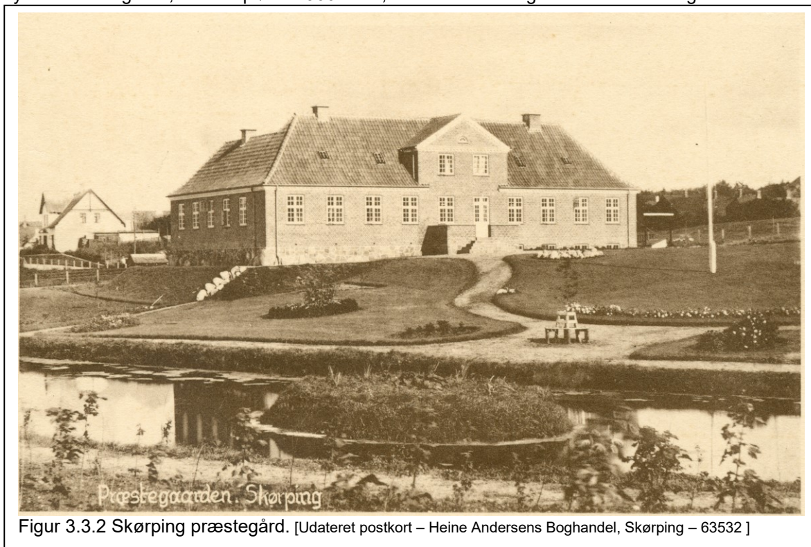
Figur 3.3.2 Skørping præstegård. [Udateret postkort – Heine Andersens Boghandel, Skørping – 63532 ]

Uanset om der er tale om egentlige gårde eller de senere præsteboliger, er de et markant indslag i bybilledet. Boligerne, der er opført i 1900-tallet, vil man nok betegne som herskabelige villaer.