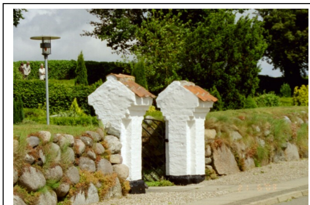
Figur 3.2.2 Kirkegårdsåbningen i Gudum – et par kilometer nord for Vårst. [OP]

De fleste kirker er omgivet af kirkegårde.