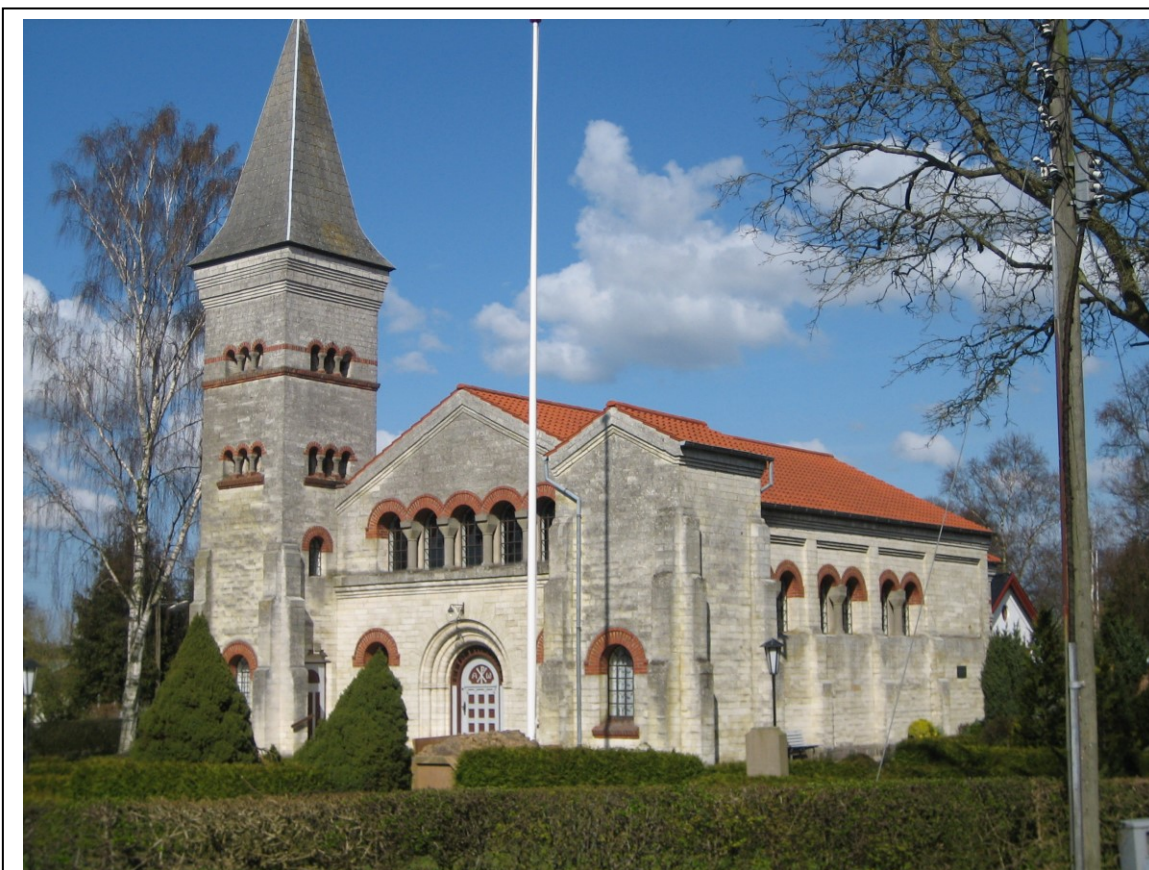
Figur 3.5.1 Frimenighedskirken i Havrebjerg, der er opført i 1904. Den hvide streg midt i billedet er en flagstang [OP]

Ser man i indholdsfortegnelsen i Paul Nedergaards "Dansk præste og sognehistorie", bind 5 – Ålborg stift, omtaler han 8 valgmenigheder. Der kunne i nogle tilfælde være tilknyttet flere kirker til samme menighed, hvilket f. eks var tilfælde i de 2 nedenfor nævnt menigheder. Derfor er det ikke usandsynligt, at antallet af kirker er større.