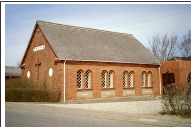
Figur 3.4.2 Selv om Hadsund ikke er en af de undersøgte byer, bringes alligevel et billede af missionshuset Tabor fra denne by. [OP]

Der er stor forskel på antallet af missionshuse på de enkelte strækninger. På Himmerlandsbanen var der missionshus i 3 af de 4 undersøgte byer, mens der kun var 2 ud af de 12 byer på AHJ, der havde missionshus. Af et kort i "Historisk Atlas Danmark" fremgår det, at der var markant flere missionshuse i den sydvestlige del af det undersøgte område end i den østlige del. 2)