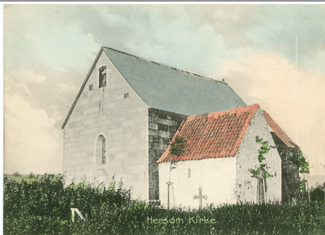
Figur 3.2.1 Hersom kirke – et eksempel på en kullet kirke. [Udateret postkort – Stenders forlag - 6906]

I Danmark er der lidt over 200 kullede kirker, der er kirker uden tårn.