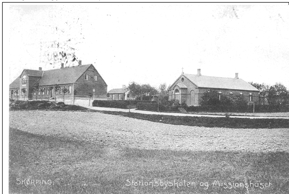
Figur 3.4.1 Skørping: "Stationsbyskolen og Missionshuset".

Missionshusene var en væsentlig del af dette arbejde. I starten anvendte man udtrykket "kristelige forsamlingshuse", og det udtrykker på glimrende måde deres funktion. Her samledes man til møder, søndagsskole og juletræsfest. 1)